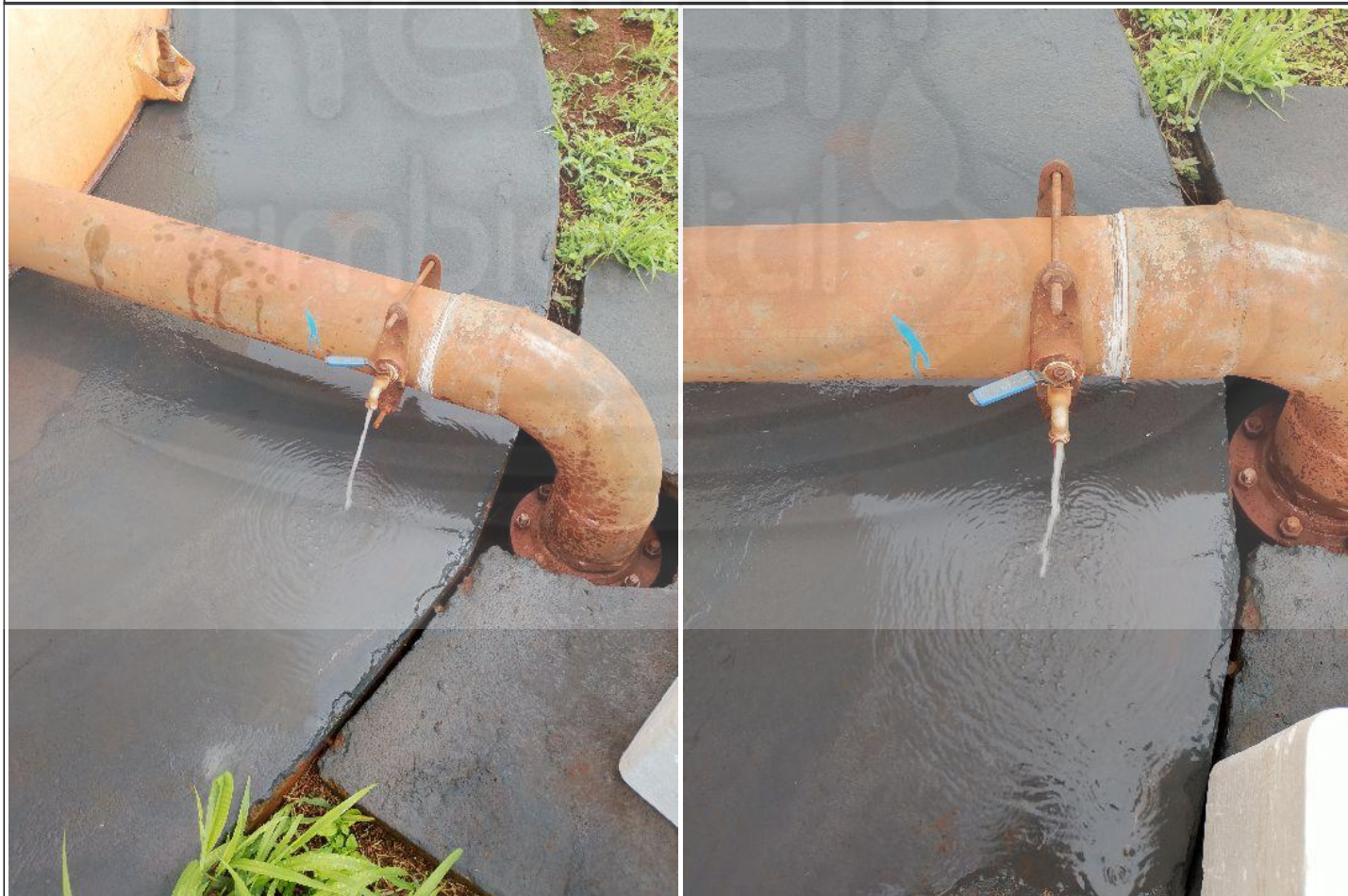
Relatório de Ensaios tipo A - Ensaios Acreditados conforme ABNT NBR ISO/IEC 17025:2017